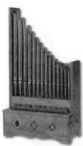
Orgue portatif ou Régale

La pavane se caractérise par son tempo lent, sa mesure binaire (le temps se divise en 2) son rythme dit « rythme de tambourin :